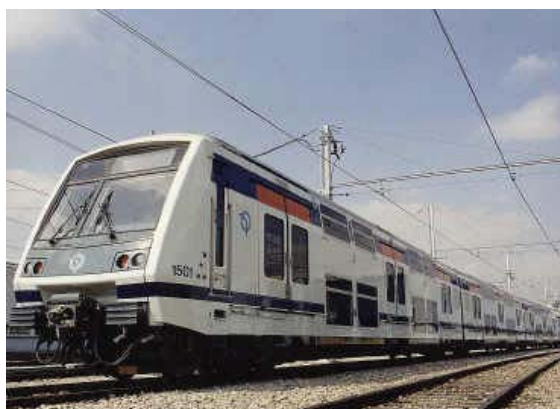
219125 - 28/03/1998 Valenciennes futur MI09 ligne A du RER - 196 M€ Alstom/Bombardier