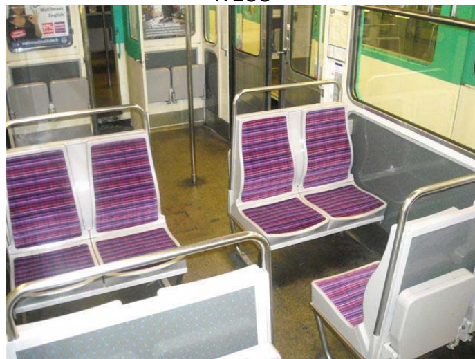
Évreux (rénovations sièges / vitres) - 1 M€ AIV