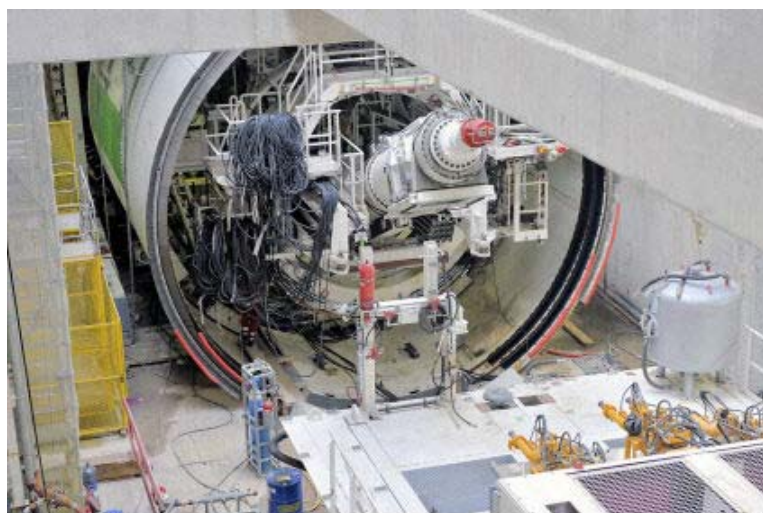
Prolongement ligne 4 à Montrouge - 16 M€ BEC, Solétanche, Sotraisol....

9017D23 - 27/02/2009