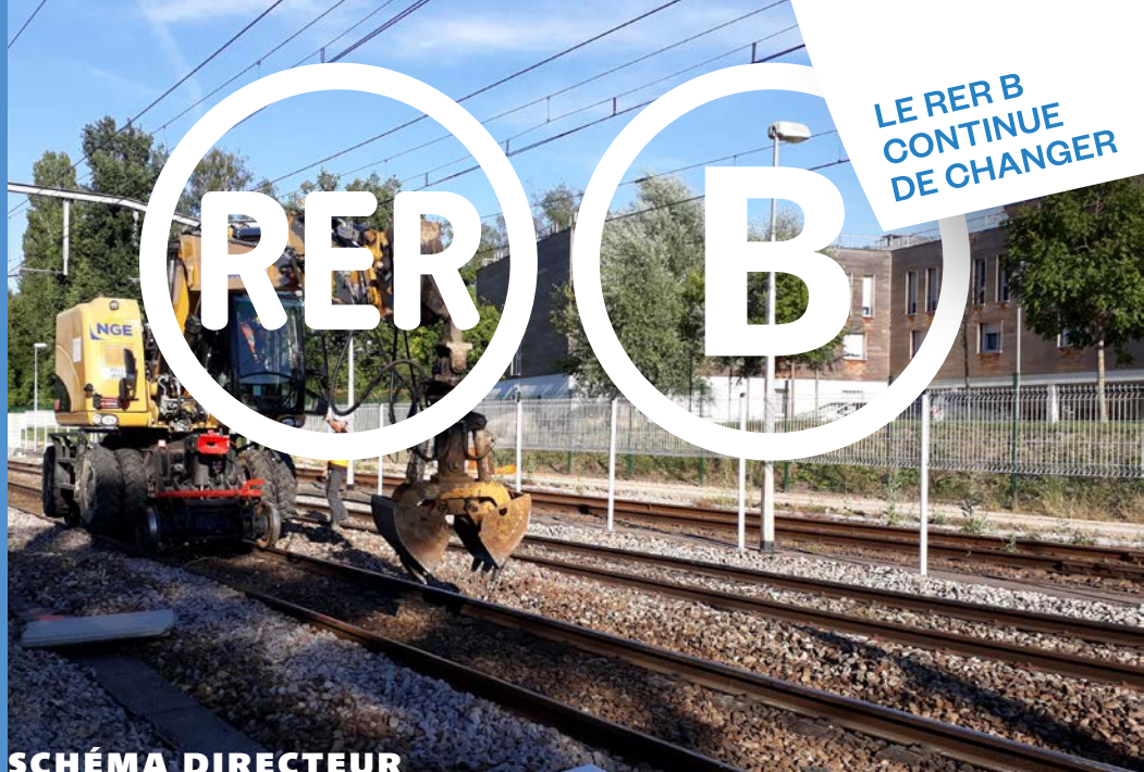
SCHÉMA DIRECTEUR DU RER B