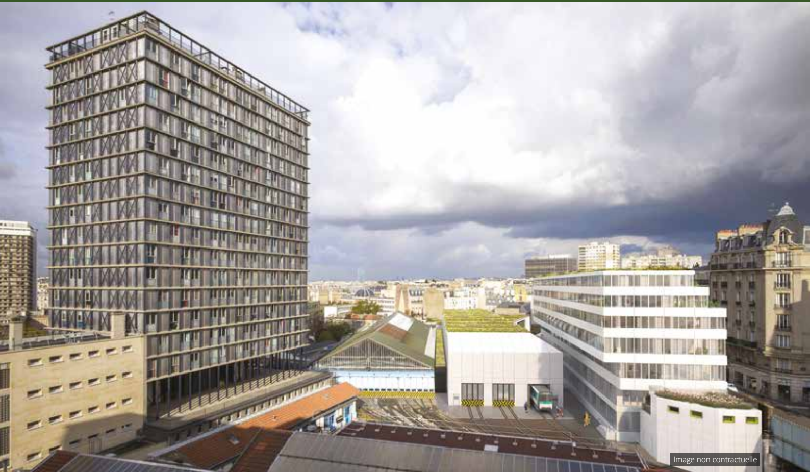
Image non contractuelle