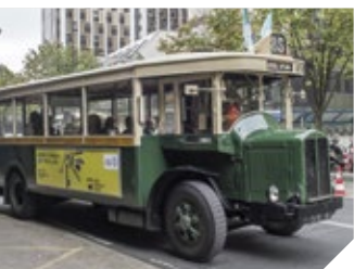
Photo sur bus TN à plateforme

Samedi 17 et dimanche 18 - 10h-12h / 13h-17h - sans inscription - Départ Maison de la RATP - 189 rue de Bercy, Paris 12 ème